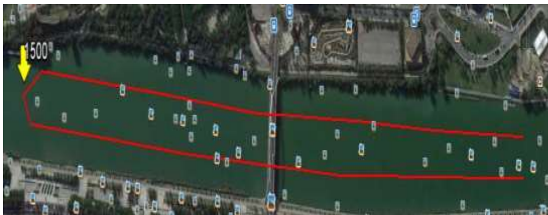
Recorrido: 2 vueltas a un circuito 3000m